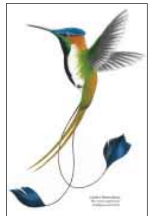
Violettscheitel-Flaggensylphe Colibrí Maravilloso Dibujo: Corporación Turística Amazónica

Los textos publicados reflejan la opinión del autor que no necesariamente es la de los editores